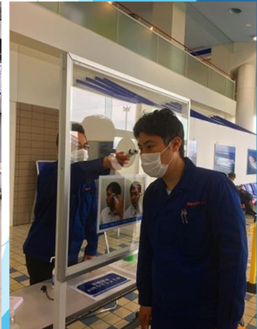
測定場所:飛沫防止のため防護板を設置