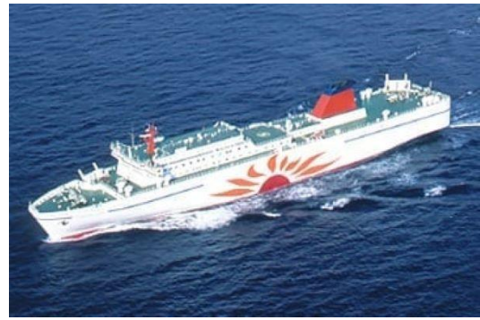
(復路: 深夜便さんからわあしれとこ・だいせつ)