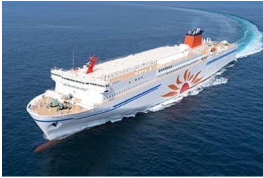
(往路: 夕方便さんからわあふらの・さつぽろ)