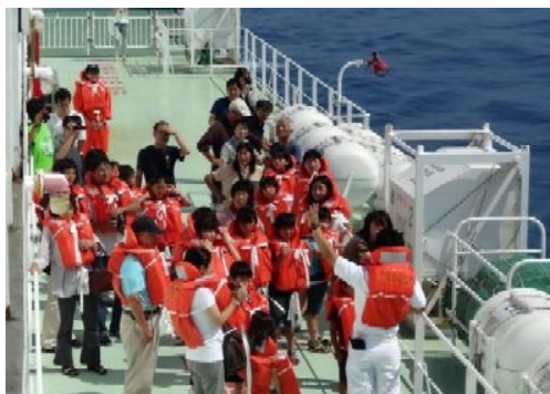
（船内見学会で避難ルートを確認）