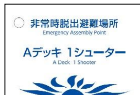
（避難場所を記載したタグ 表・裏面）