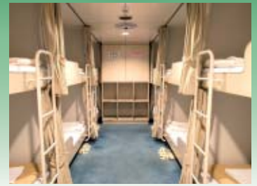
カジュアルルーム

“ふらの・ストーリー” 11,800円 プラス ランクアップ料金 26,500円 (1名あたり) ※スイートルームは乗船中のお食事をサービス。