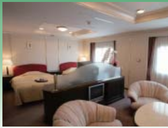
スイートルーム (定員 2名)