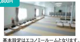
基本設定はエコミールームとなります。