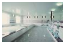
展望浴場・サウナ