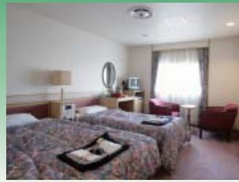
デラックスルーム (定員 2名)