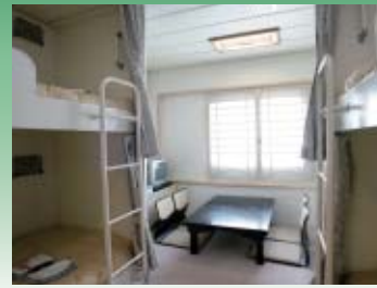
スタンダードルーム (定員 4名)